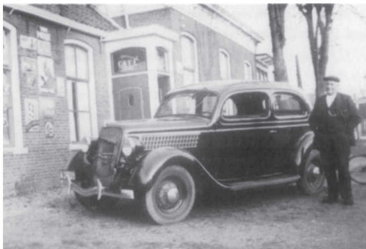
Klaas Hekma. In zijn café werden de Zuidwoldenaren verzameld.

ping van het hotel krijgen de mannen het bevel naar buiten te gaan. Ze worden in gereedstaande vrachtauto's geladen. Als de motoren starten, begint een reis met een dan nog onbekende bestemming. Voor 13 jonge Bedumers is het de laatste keer dat ze een blik op hun woonplaats kunnen werpen. Ze komen niet weer terug.