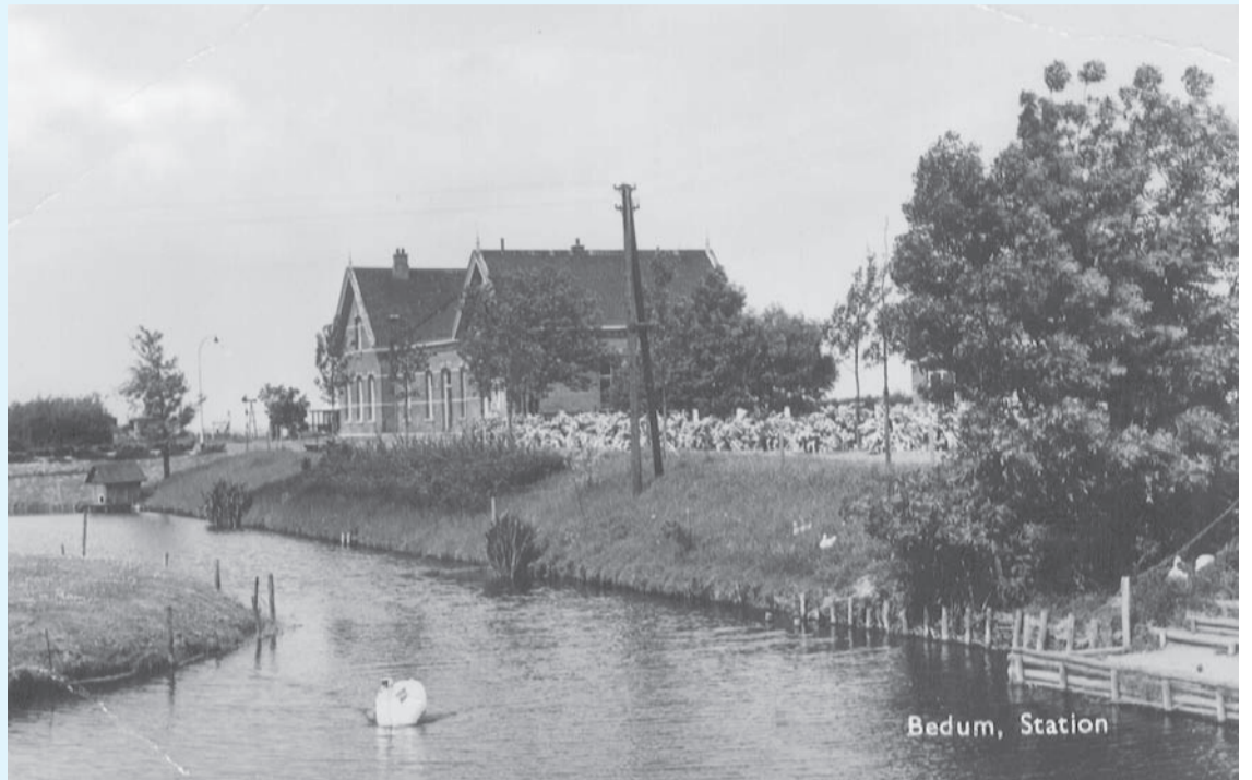
Het station in Bedum, waar de aanslag op Keijer plaatsvond.

In de vroege ochtenduren van 25 april 1944 trekken meer dan